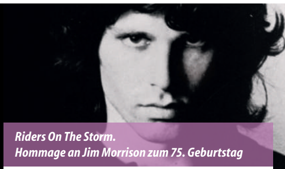
Riders On The Storm. Hommage an Jim Morrison zum 75. Geburtstag