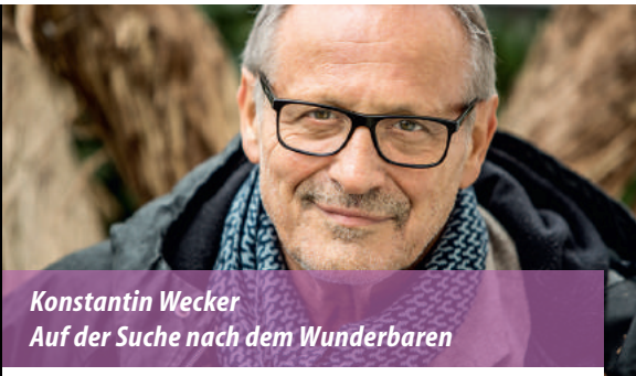
Konstantin Wecker Auf der Suche nach dem Wunderbaren