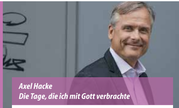
Axel Hacke Die Tage, die ich mit Gott verbrachte

Schon immer, so Axel Hacke, sei Gott für ihn ein melancholischer alter Herr gewesen, der etwas Großes schaffen wollte, doch einsehen muss, dass ihm nicht wieder gut zu machende Fehler unterlaufen sind. In „Die Tage, die ich mit Gott verbrachte“ schildert Hacke seine Begegnung mit diesem Schöpfer. Gott ist unglücklich über die Unvollkommenheit des eigenen Werks und sucht nun ausgerechnet bei den Menschen Trost. Eine so großartige wie versponnene Geschichte voll seltsamster Ereignisse, heiter und sehr ernst zugleich.