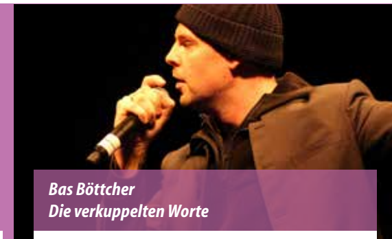
Bas Böttcher Die verkuppelten Worte

Als Pionier der Poetry-Slam-Bewegung prägte Wort-Akrobat Bas Böttcher den Stil einer neuen Live-Literatur, die explizit für die Bühne verfasst wird. Mit Spaß und Wortkunst nimmt er das Publikum mit auf eine Reise durch das Universum der Sprache. Böttchers Auftritte sind Lesung ohne Vorgelesenes. Eine Sprach-Zauber-Schau im komprimierten Lyrikformat. Worte tanzen zwischen Sinn und Klang, Sätze werden zu Melodie und Rhythmus. Der Satzbau-Bausatz des Slam Poeten scheint unerschöpflich. In kurzweiligen Sinn-, Klang- und Wort-Arrangements lässt er spielerisch Welten entstehen und wieder verschwinden.