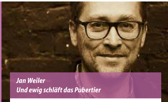
Jan Weiler Und ewig schläft das Pubertier

Es ist wieder da und wenn es erst einmal wach ist, hält es die Welt in Atem: Das Pubertier. Während Carla den Führerschein macht und mit ihrem Vater über die Preise von WG-Zimmern debattiert, hat sich Nick zum Parade-Exemplar entwickelt. Das männliche Pubertier besticht durch faszinierende Stellungnahmen zu den Themen Mädchen, Umwelt und Politik sowie durch seine anhaltende Begeisterungsfähigkeit für ganz schlechtes Essen und seltsame Musik. Er wächst wie entfesselt und trägt T-Shirts und Frisuren, die uns dringend etwas sagen wollen. Der dritte Teil der Pubertier-Saga dreht sich um Liebe, Hautunreinheiten (und ihren Zusammenhang), Urlaub, Schule, schlechte Vorbilder und gute Einflüsse. Und um die Frage, wann diese verfluchte Pubertät eigentlich aufhört. Jan Weiler sieht manchmal in den Spiegel und denkt: Eigentlich nie.